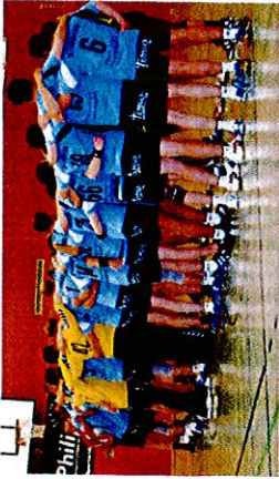
Haben ihr Können mittlerweile auch in der Halle unter Beweis gestellt: Die Herren der SG1 Altendorf/Ruhr